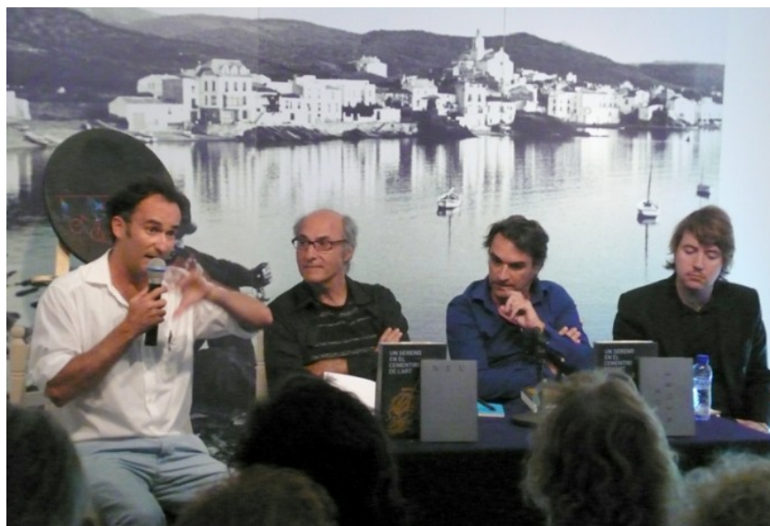
( http://www.nuvol.com/wp-content/uploads/2012/07/P1060089-2.jpg )